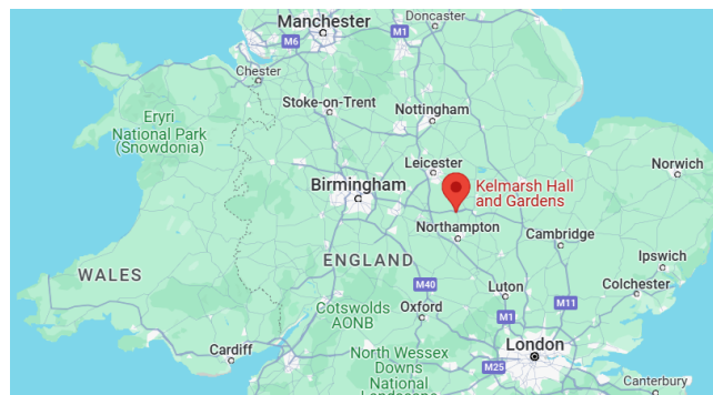
Figura 4.1: Mapa que muestra la ubicación de Kelmarsh Hall en relación con Birmingham

Esperamos tener acceso a wifi en el sitio. Nuestro objetivo es que el wifi se priorice para los grupos internacionales para evitar que alguien tenga que pagar altos precios de datos para usar su teléfono para verificar horarios de vuelos, arreglos de viaje y para que los jóvenes puedan contactar a casa cuando lo necesiten. Probablemente no habrá wifi suficiente para teletrabajar, transmitir videos y hacer llamadas por Zoom, pero haremos todo lo posible para proporcionar un acceso básico para quienes más lo necesiten. Recuerda revisar los contratos de telefonía móvil antes de viajar, ya que los cargos por pueden ser altos; ¡asegúrate de desactivar el roaming si no quieres pagar esas tarifas!